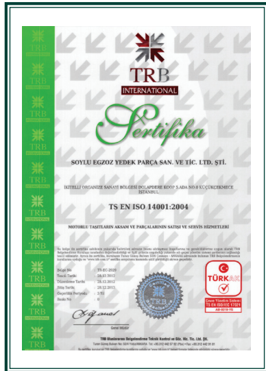
TS EN ISO 14001 - 2004 Çevre Yönetim Sistemi