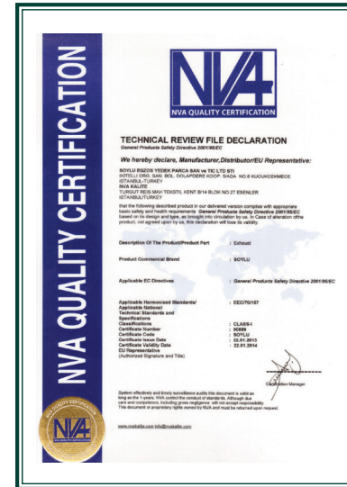
CE Belgesi - EEC 70/157 Standartları