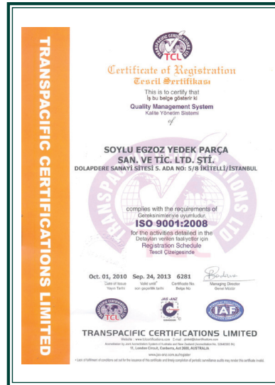
ISO 9001- 2008 Kalite Yönetim Sistemi